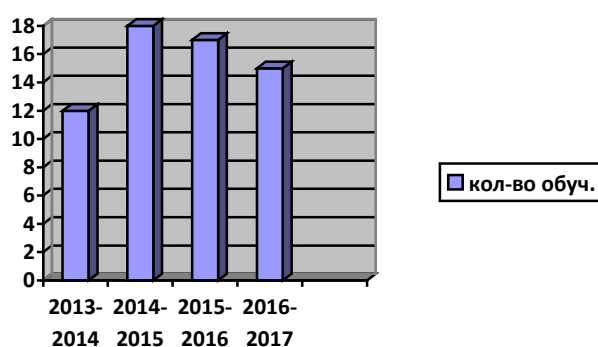
Диаграмма 1. Динамика численности контингента обучающихся школы:

Основная миссия школы-сада – обеспечение качественного и доступного образования в условиях комфортной здоровьесберегающей образовательной среды.